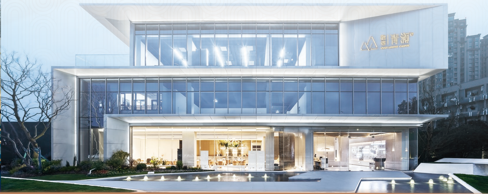
Nanjing Qinglan (南京青瀾)