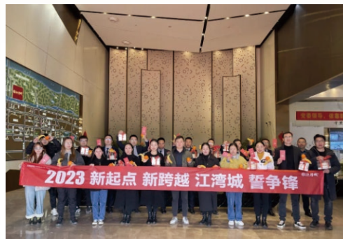
融信河南區域舉行開工儀式

融信一向十分支持及關懷員工。通過向一線人員送出開工蛋糕及賀卡等形式，致以新春祝福，積極投入到新一年的工作之中。