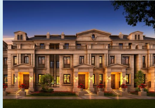
融信·永興首府(杭州)